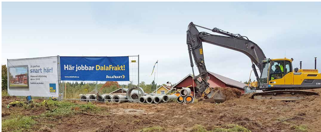
DalaFrakt mitt i projektet i Nygårdarna.