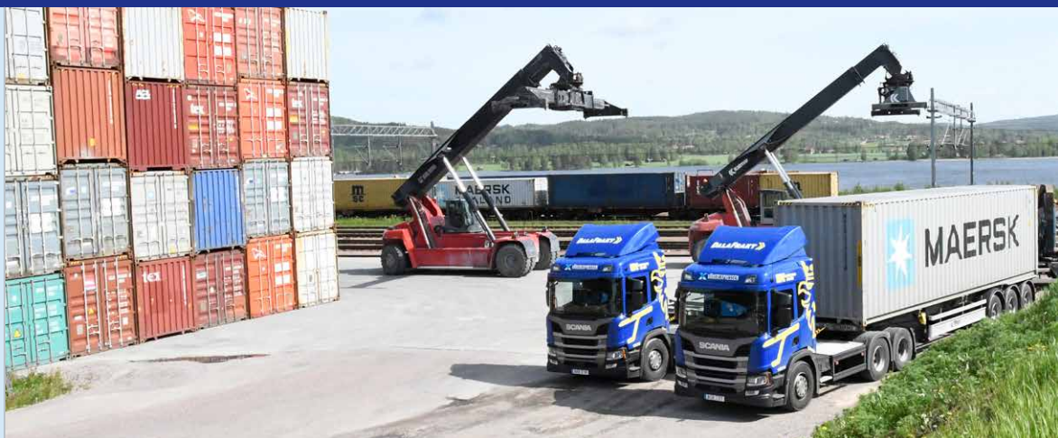
DalaFrakts bilar står på rad vid containerterminalen i Insjön. Chaufförerna är snabbt redo att snabbt köra ut containers till mottagarna.