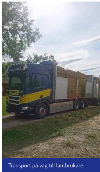
Transport på väg till lantbrukare.

På våren och försommaren transporterar DalaFrakt gödsel och utsäde till lantbrukare i Dalarna, Gästrikland och delar av Hälsingland. Gödseln hämtas från Skara alternativt Norrköping och utsädet lastas på i Skänninge som ligger i Västergötland.